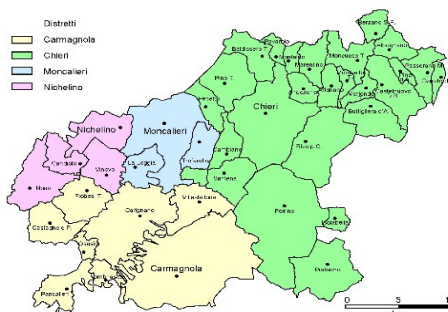
Fig. 1. I 40 comuni dell'ASL TO5 suddivisi per distretti

Distretto di Nichelino (76.714 ab.) Candiolo, Nichelino, None, Vinovo.